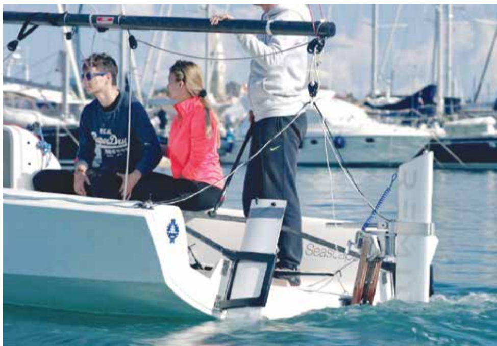
Ekipa Remiga je koncept izvenkrmnega motorja postavila na glavo.